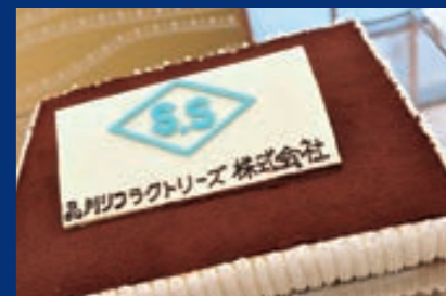
2009年統合パーティー記念ケーキ