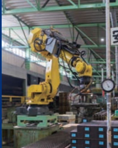
岡山工場第4製造室の自動成形ライン