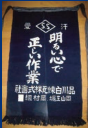
岡山工場協力会社昭和産業の前垂れ