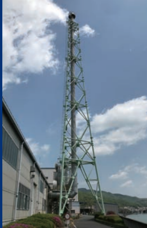
品川一高い煙突 岡山第2工場