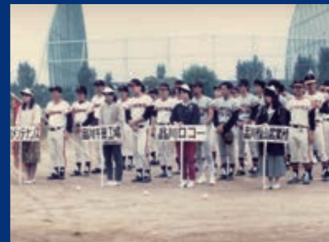
品川グループソフトボール大会

創業から100周年を迎えた1975年(昭和50年)以降の50年間は、当社にとって決して平坦な道のりではありませんでした。とりわけ、1975～2009年の35年間は、激動する経済状況と戦ってきた時期と言っても良いでしょう。