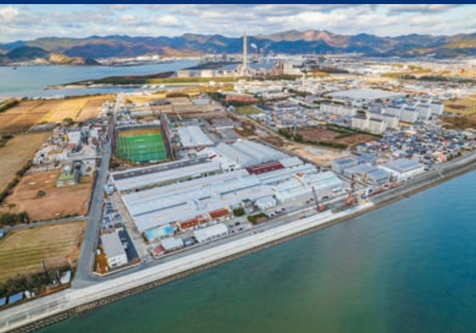
千種川河口から見る赤穂工場