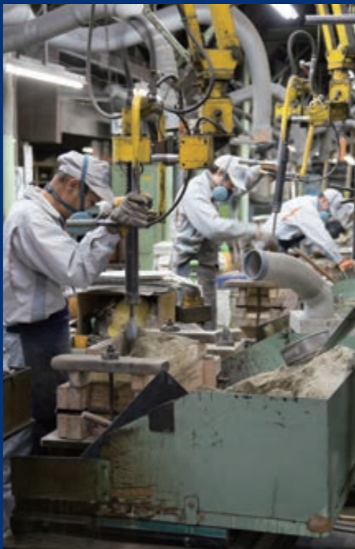
岡山工場手打ち成形